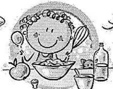
СЛЕДУЙТЕ ПРИНЦИПАМ ЗДОРОВОГО ПИТАНИЯ И ВОСПИТЫВАЙТЕ ПРАВИЛЬНЫЕ ПИЩЕВЫЕ ПРИВЫЧКИ