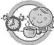
СОБЛЮДАЙТЕ ПРАВИЛЬНЫЙ РЕЖИМ ПИТАНИЯ