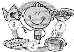
НЕ ПРОПУСКАЙТЕ ПРИЕМЫ ПИЩИ